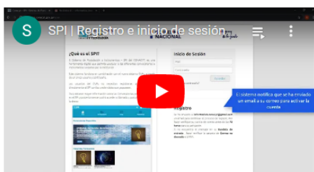
Tutorial de registro al SPI.

Este sistema funciona en combinación con el CVPy, a través de un único usuario y contraseña.