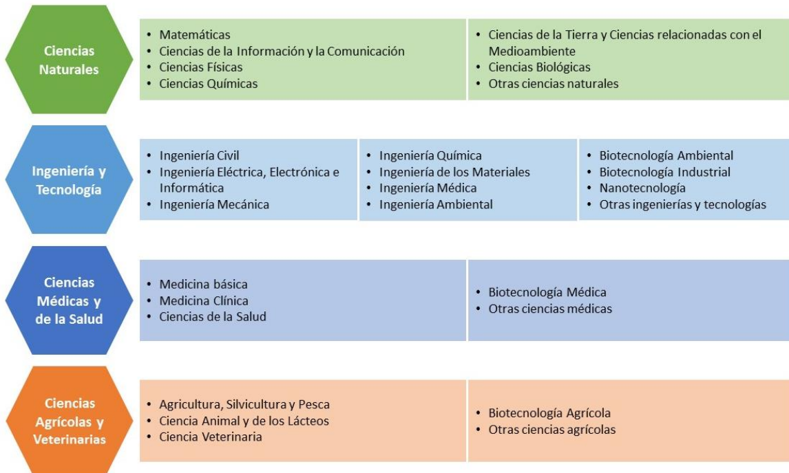
Figura 1.

Las áreas de la ciencia y sus disciplinas, establecidas por la Organización para la Cooperación y el Desarrollo Económico – OCDE según el Manual de Frascati (2015), a las que se alinean los cursos de corta duración implementados por el CABBIO son: