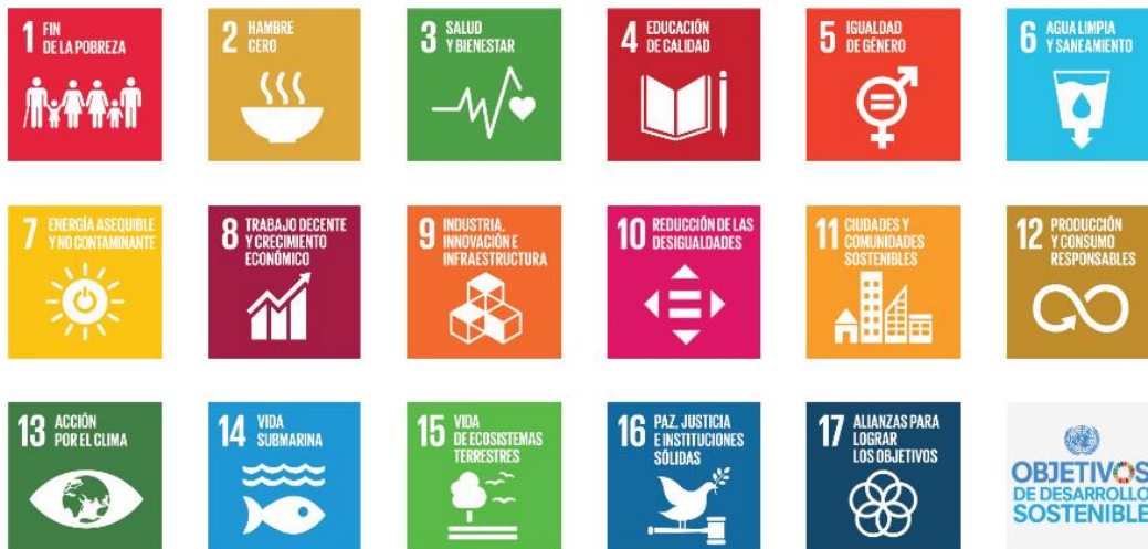
Figura 2. ODS establecidos por la ONU. 1